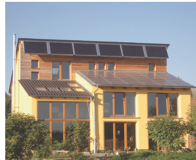
MAISON PASSIVE à Grimma, Schkortitz (Allemagne)