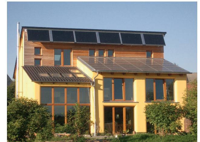
Passivhaus in Grimma OT Schkortitz